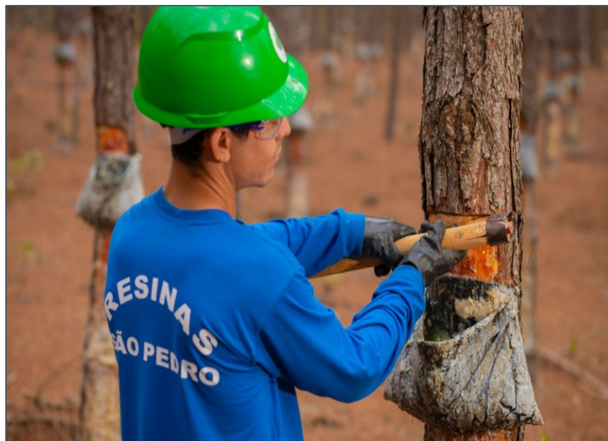
Figura 4. Técnica de extração de resina

Tratando-se a respeito do método de extração de goma resina, este procedimento é realizado via manual, no qual se inicia a partir do 10º ano da floresta, podendo se estender até o 20º ano das árvores ou mais. Para a extração da goma resina, utiliza-se a ferramenta chamada “estriador”. Abre-se um corte de 15 a 25 cm entre a casca e o lenho da árvore, logo acima do saquinho, no qual posteriormente se aplica a pasta estimulante para que os canais resiníferos não se fechem.