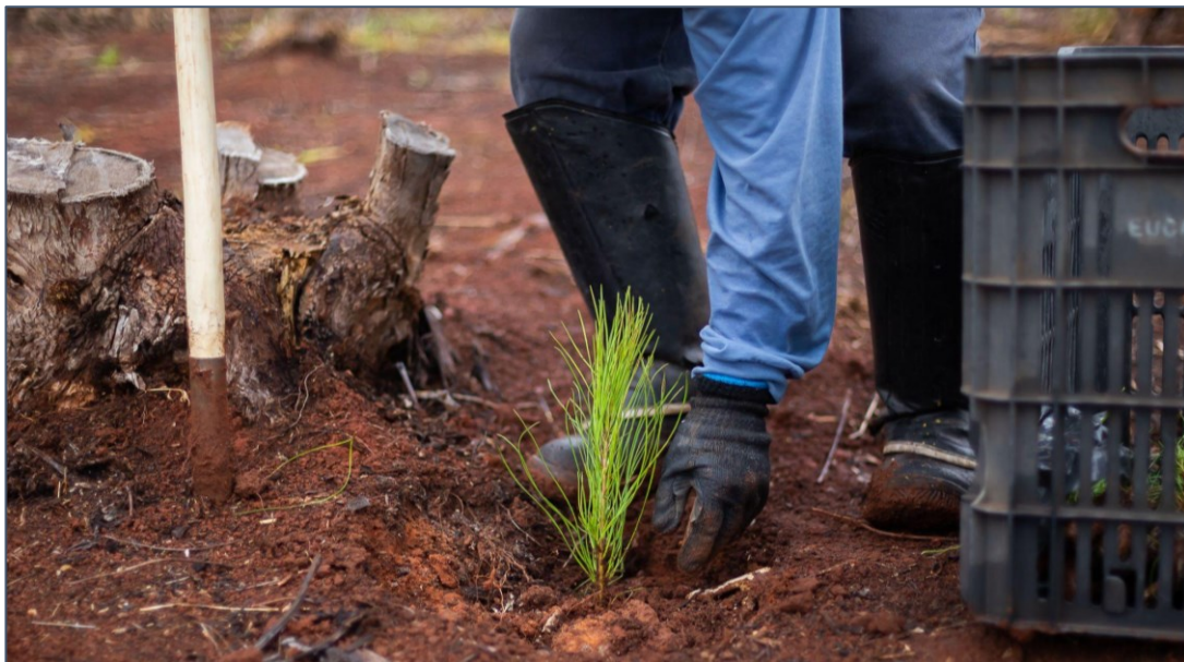
Figura 3. Plantio e replantio de Pinus - Grupo RB

Desta forma, visando principalmente a produção de resinas, as espécies escolhidas para serem plantadas atualmente pela empresa integram o gênero Pinus , família Pinaceae. Dentre as espécies de Pinus , destaca-se, enquanto principal espécie produzida, o Pinus elliottii . Além disso, há alguns plantios e condução de Pinus caribaea , além do híbrido do elliottii com caribaea e, algumas áreas possuem Pinus taeda .